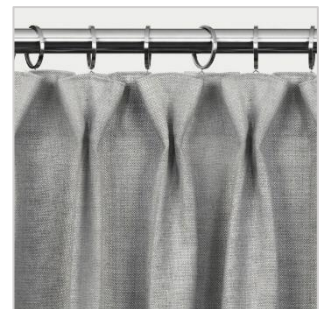
Modell 4 Gruppefold