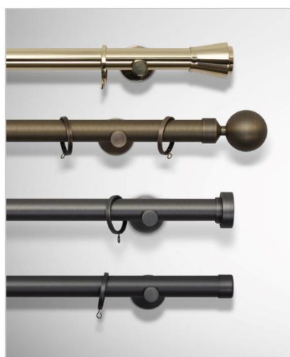
Madison Ø 30 mm