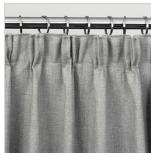
Modell 3 Viftefold