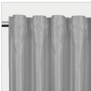
Modell 5 Stangbånd