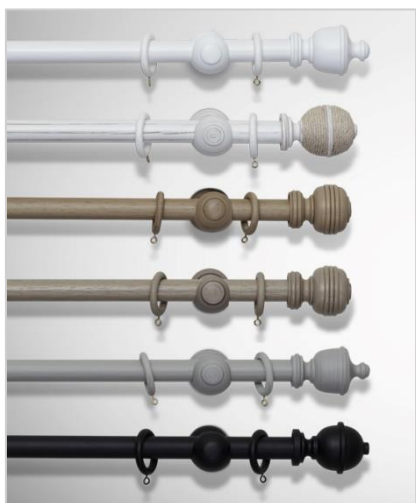
Wood Ø28 mm

Gardinstenger i tre utførelse leveres i to valgfri tykkelser på stangen (Ø28 mm og Ø35 mm), og i et stort utvalg farger og finisher. Stangen og annet tilbehør inklusive veggholdere, endedekor og eventuelt ringer leveres i den samme, matchende farge.