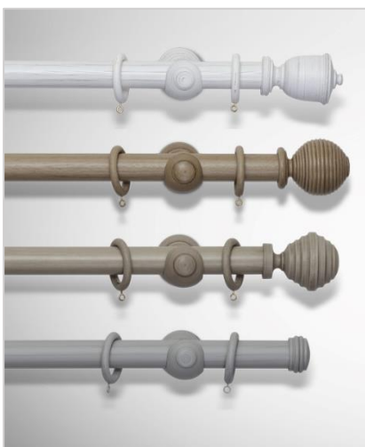
Wood Ø35 mm