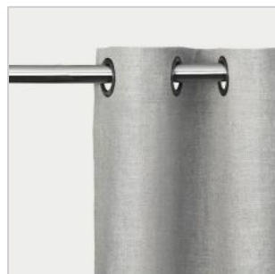
Modell 6 Maljegardin