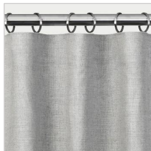
Modell 2 Wavefold