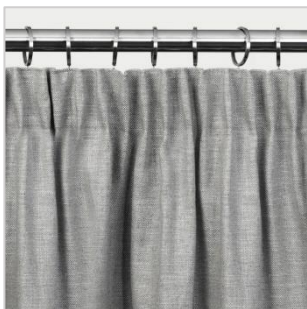
Modell 1 Blyantfold

Modell 1-4 henges opp ved bruk av gardinringer som leveres i riktig antall i forhold til stanglengden og foldtype. Modell 5-6 tres inn på stangen gjennom et stangbånd eller påsatte stålmaljer.