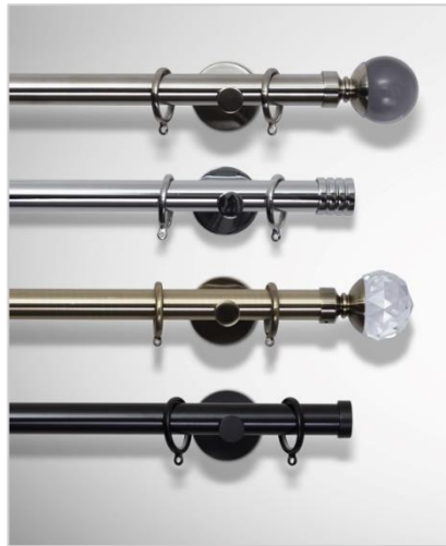
Lux Ø29 mm

Gardinstengene måltilpasses i nøyaktige lengder fra 40 cm til 420 cm, og monteres på vegg ved bruk av veggholdere. Du kan velge ulike spyd som dekorelement i hver ende av stangen, som leveres i samme farge. Lengden på endedekoren kommer i tillegg til stanglengden.